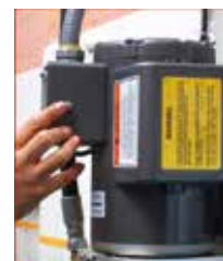
Operación con Solo Dedo