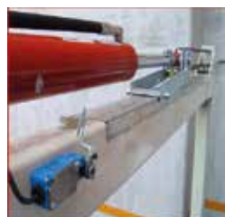
Sistema de Seguridad Anticaída