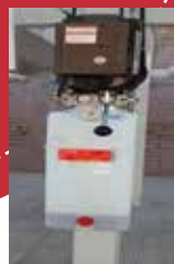
Unidad Hidráulica Compacta