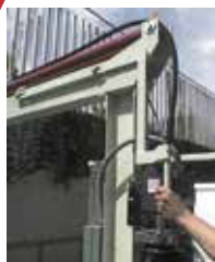
Operación Manual Anticaída