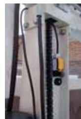
Paro Limite Automático